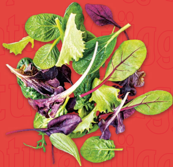
Unser Salat- und Dressing-Angebot