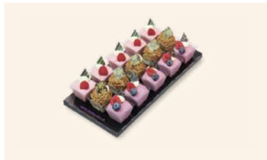
Crèmes & Mousses