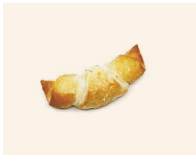
Nuss- und Mandelgipfel