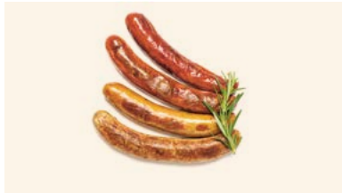
Grill Quar- tett Würste

Saftiges Poulet-Patty im luftigen Weissbrötli